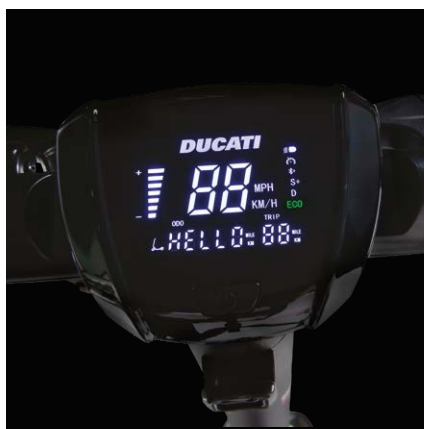
Velký, 3,5" displej