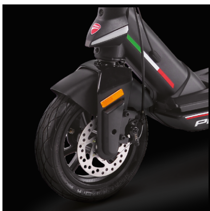
10" bezdušové pneumatiky