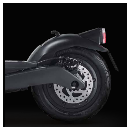
Přední a zadní kotoučová brzda se systémem KERS

Product SKU: MN-DUC-PRO3 EAN code: 8052870481412