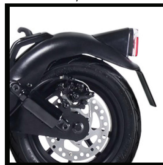
Zadní světlo se zvýšenou viditelností