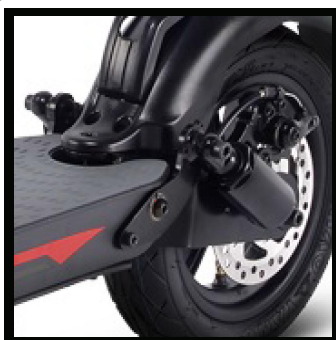
Odpružení předního i zadního kola