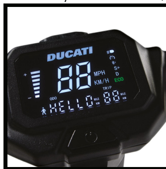
Velký, 3,5" displej