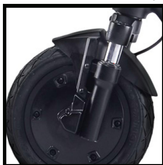
Nejnovější generace 350W bezkartáčového motoru