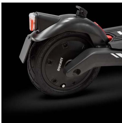
500W motor, špičkový výkon 800W