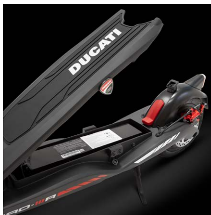
Až 55km dojezd s 499Wh baterií