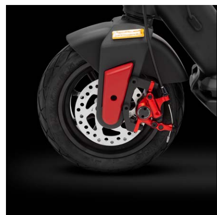
Přední a zadní semi hydraulické kotoučové brzdy